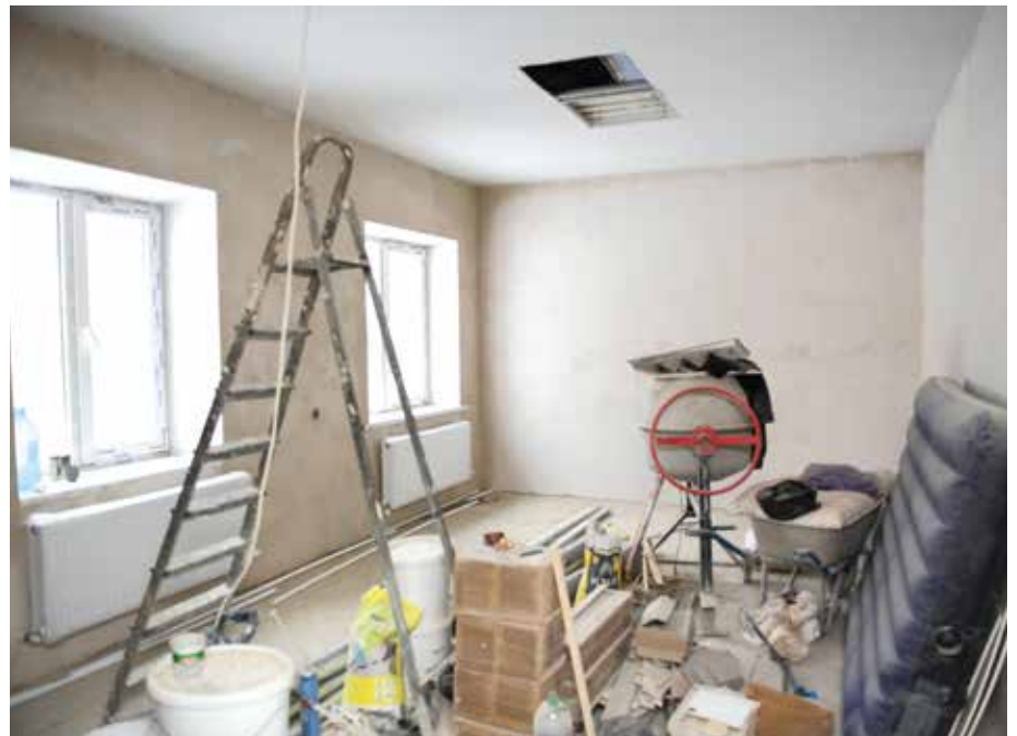
■ Der zukünftige Aufenthalts- und Aktivitätsraum.

W ir waren erstaunt, mit welcher professionellen Arbeit die bisherigen Baumaßnahmen durchgeführt wurden. So wurden Erdarbeiten, wie Gas, Wasserversorgung, Kanalisation und Stromversorgung durchgeführt und der Rohbau fachgerecht durch ein