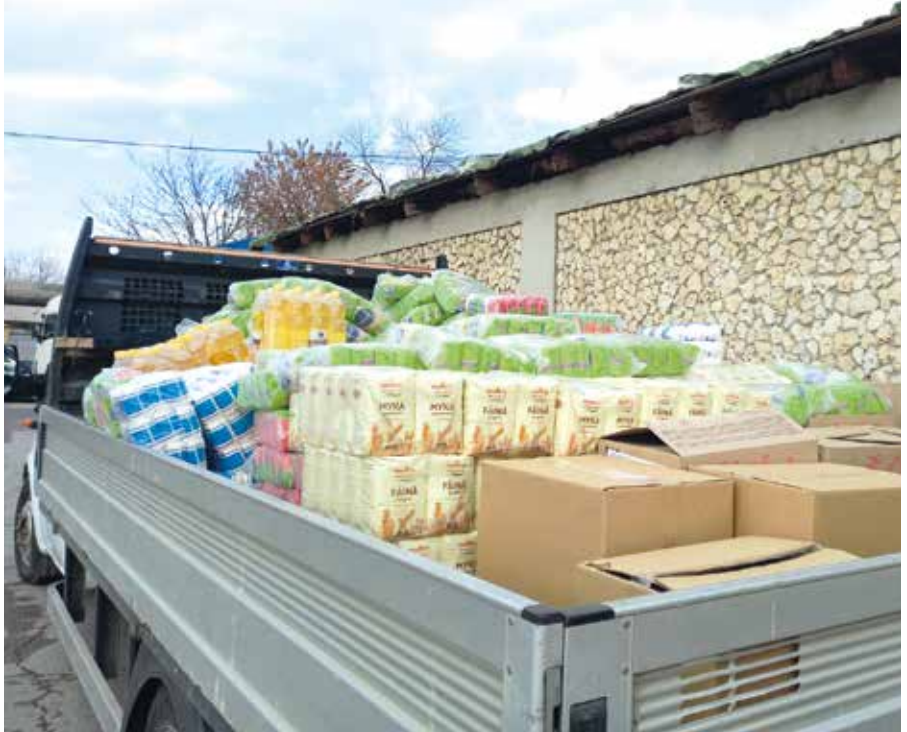
■ Die für Leova bestimmten Lebensmittel werden angeliefert

D rei Viertel dieser Lebensmittelmenge wurde den 3 Rayons – Calarasi, Ungheni und Nisporeni zugeteilt, die ihrerseits, in Form der Eigenbeteiligung, diese Lebensmittel vom Großhändler abholten und vorportioniert ihren Bürgermeisterämtern zulieferten. Diese wiederum hatten, entsprechend unserer Vorgabe, die Aufgabe die Lebensmittel bedarfsgerecht in die beschafften Kartons und Tüten zu portionieren, was einen erheblichen zeitlichen und personellen Aufwand bedeutete. Es hat uns sehr gefreut, dass sich hierzu viele Helfer/innen freiwillig bereiterklärten.