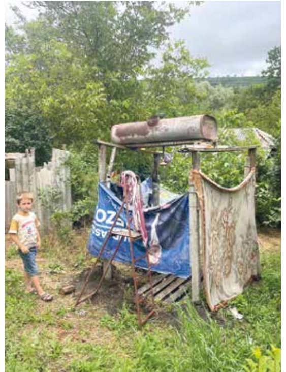
Die ehemalige Biodusche hat ausgedient