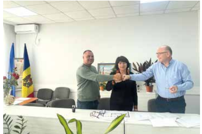
■ Der Bauvertrag zwischen den Parteien wurde gerade unterzeichnet.