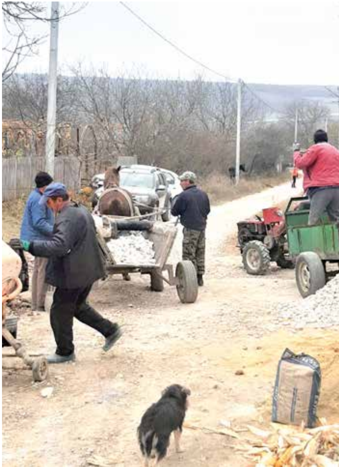
■ Die Bürger von Cobilea beteiligen sich tatkräftig bei der Verlegung der Wasserleitungen