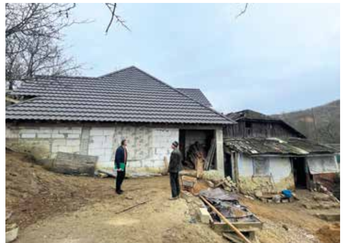
■ Der Rohbau ist bereits mit einem Dach versehen

Über weitere Fortschritte des Bauprojektes Burca, werden wir später berichten.