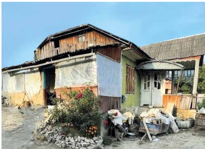
■ Die alte Hütte hat ausgedient