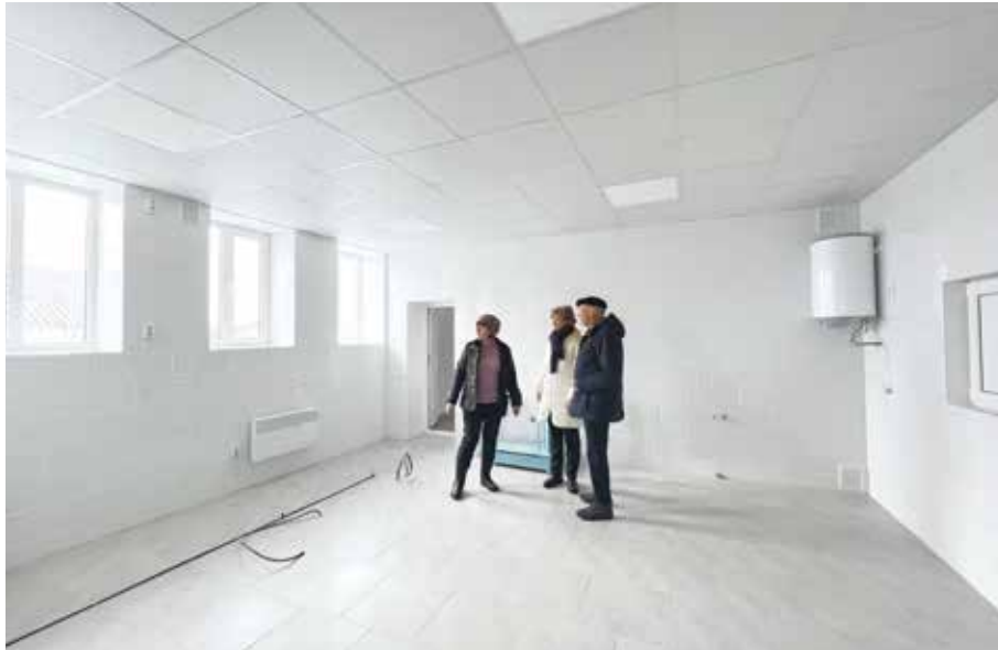
■ Der baulich fertiggestellte Küchenraum mit dem erforderlichen Warmwasserboiler und der Durchreiche in den Esssaal, die Elektroanschlüsse, Heizungsradiatoren und Erdung für die Küchengeräte sind bereits vorhanden. Noch fehlt die gesamte Inneneinrichtung.