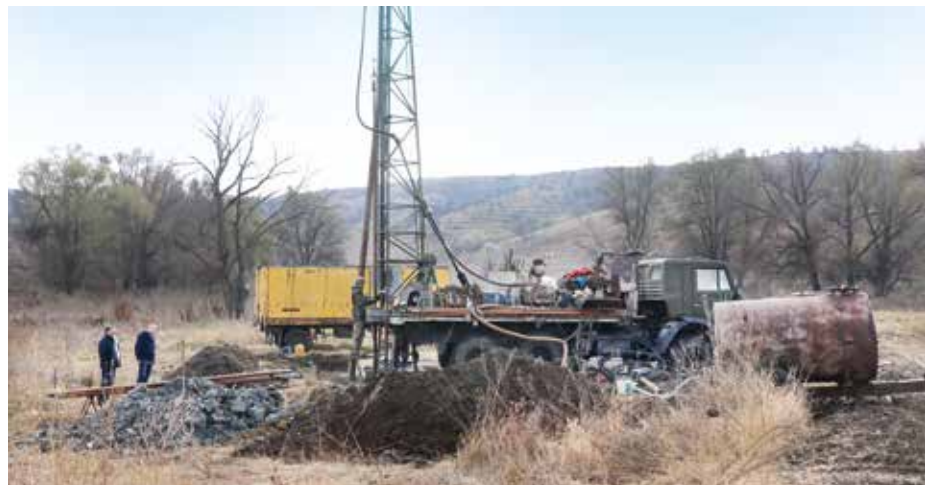
■ Nach langen Bohrarbeiten, wird die ehemalige Quelle des vor 25 Jahren erstellten, völlig versandeten Brunnens in Dereneu, wieder aktiviert.

sich nach dem Verfall der Sowjetunion für die Instandhaltung der Wasseranlagen zuständig, was übrigens in vielen Ortschaften Moldau's der Fall ist.