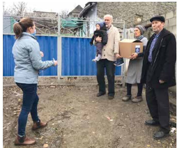
■ Eine Sozialhelferin hilft uns bei der Verteilung der Lebensmittel