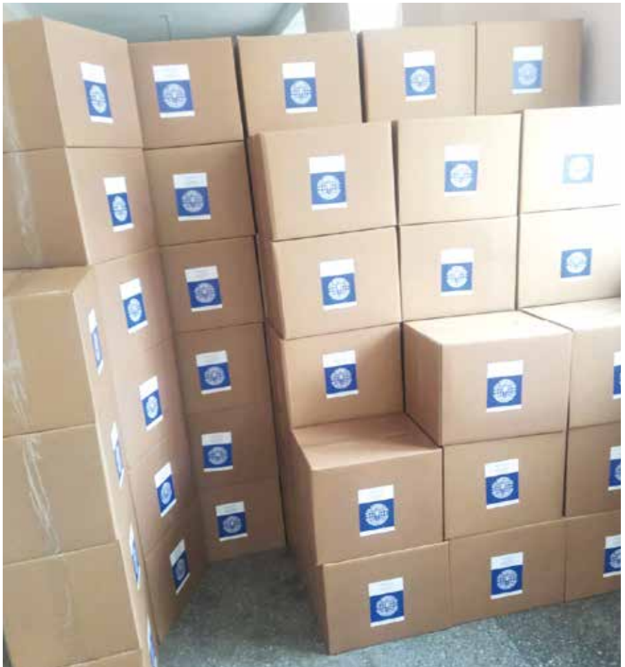
■ Die für Großfamilien bestimmten Lebensmittelkartons sind bereits verpackt und zum Abtransport bereitgestellt.