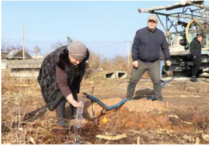
■ Endlich, das Wasser fließt