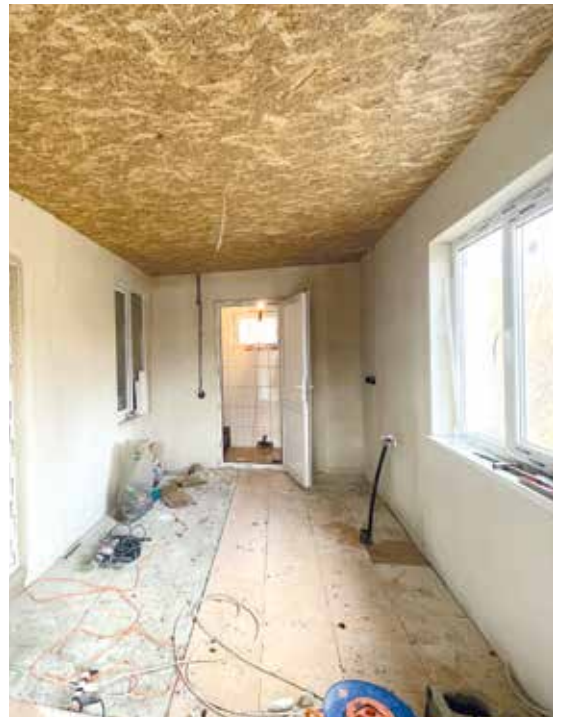
Innenarbeiten im Anwesen HASNAS, im Hintergrund die geflieste neue Dusche mit Toilette