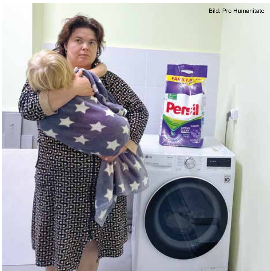
■ Dankbar nimmt die Mutter einer kleinen Patientin die neu installierte Waschmaschine in Betrieb.

Es wäre so sehr notwendig, hier eine Waschmaschine für diese Zwecke zu installieren. Nach kurzer Rücksprache konnte Marina vor Ort entscheiden, dass unmittelbar eine Waschmaschine für diese Zwecke beschafft und installiert werden musste.