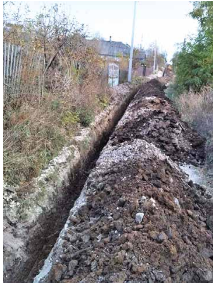
■ Ein Teil der 3000 Meter langen Wasserleitung ist bereits mit dem Bagger ausgehoben worden