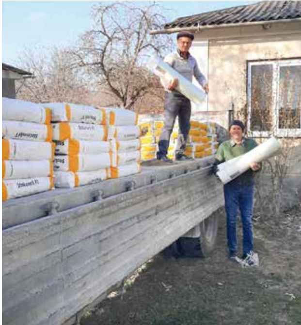
■ Anlieferung des STOTMEISTER Verputzmaterialies

Erfreulich ist, dass bei diesen Baumaßnahmen die von der Firma STOTMEISTER in erheblichem Umfang gespendeten Baumaterialien zum Einsatz kommen konnten, was unsere finanzielle Belastung verringerte.