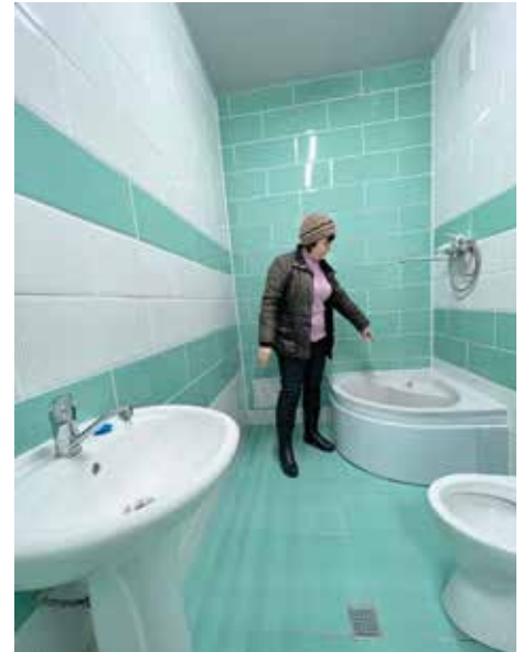
■ Der Hygienebereich wurde vollständig gefliest, mit einer Dusche, Toilette und Waschbecken versehen