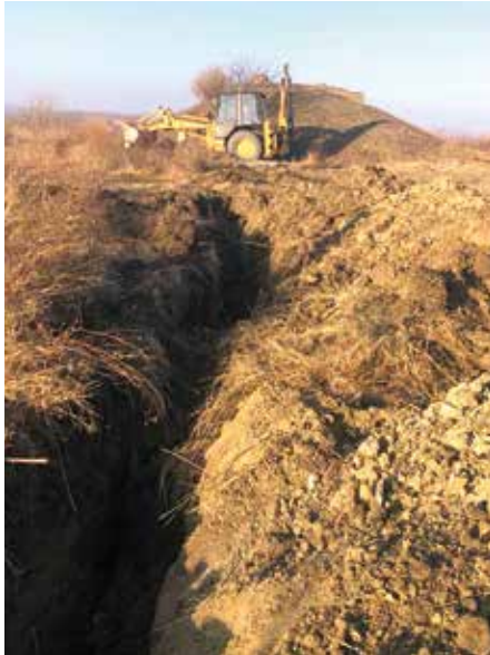
■ Bild des Wasserreservoirs im Hintergrund. Die letzten Meter der Wasserzuleitung zum Reservoir werden ausgehoben.

Fassungsvermögen von 120 m 3 , einer Förderpumpe, dem Bau einer Förderwasserleitung mit einer Länge von 750 m bis zum Reservoir, inclusive aller notwendigen Stromanschlüsse, verantwortlich zeichnete.