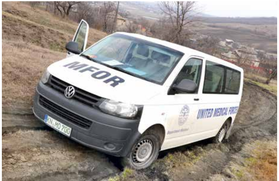
■ Nichts geht mehr