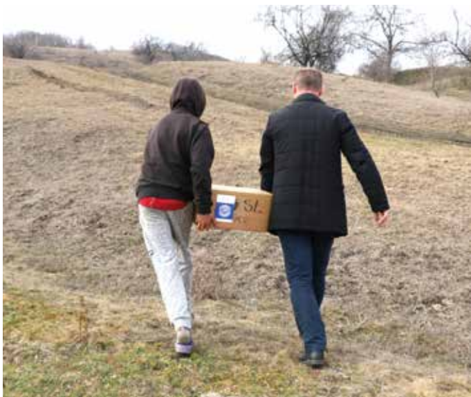
■ Wenn vier Räder nicht mehr ausreichen, kommen vier Beine zum Einsatz