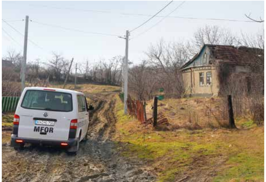
■ Es ist oftmals ein Kampf die bedürftigen Familien zu erreichen