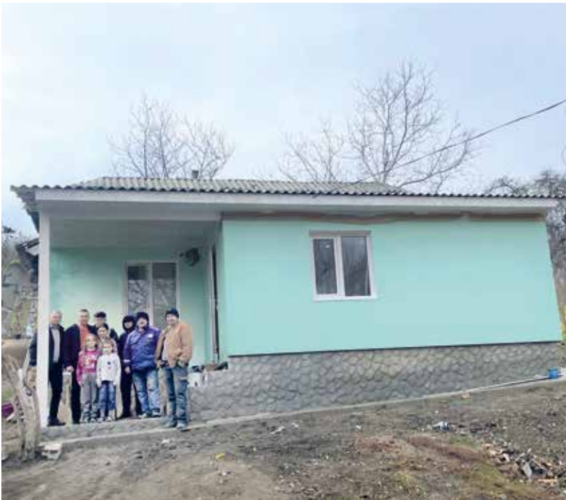
Das fertiggestellte Anwesen HASNAS, im Bild erkennen Sie die Kinder Hasnas mit unseren Mitarbeitern und dem Bauteam.