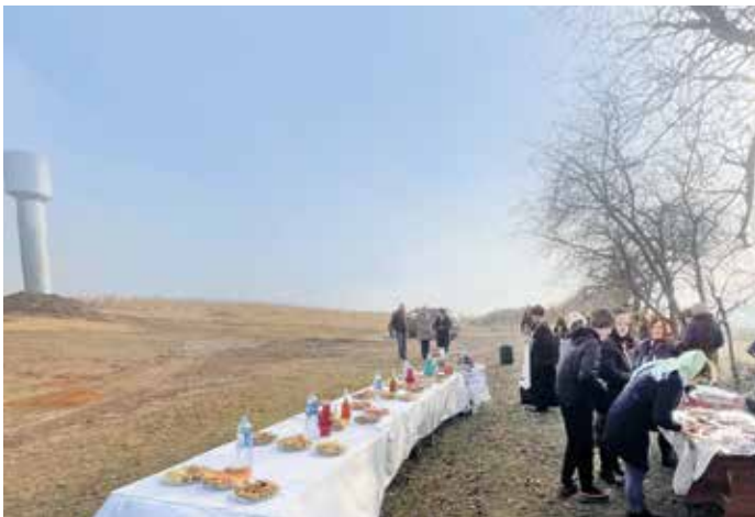
■ Trotz des kalten Windes haben sich die Bürger von Cobilea zu der Einweihungsfeierlichkeit eingefunden.

Heute, da wir diese Zeilen schreiben, meint Marina spontan: „schade, dass es uns nicht gelingt, diese Atmosphäre unseren Lesern vollständig vermitteln zu können“.