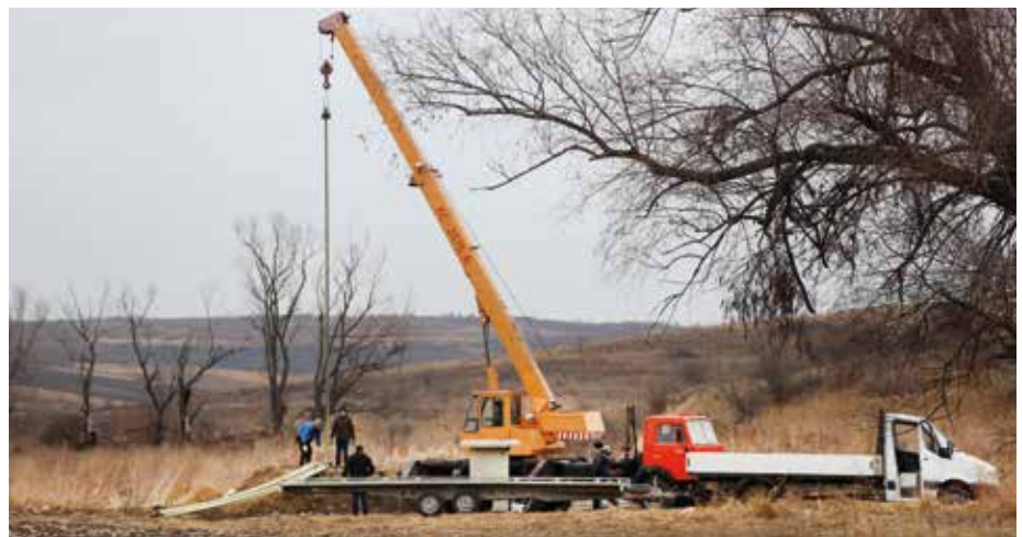
■ Die Neuerbohrung der instandgesetzten Quelle beginnt.