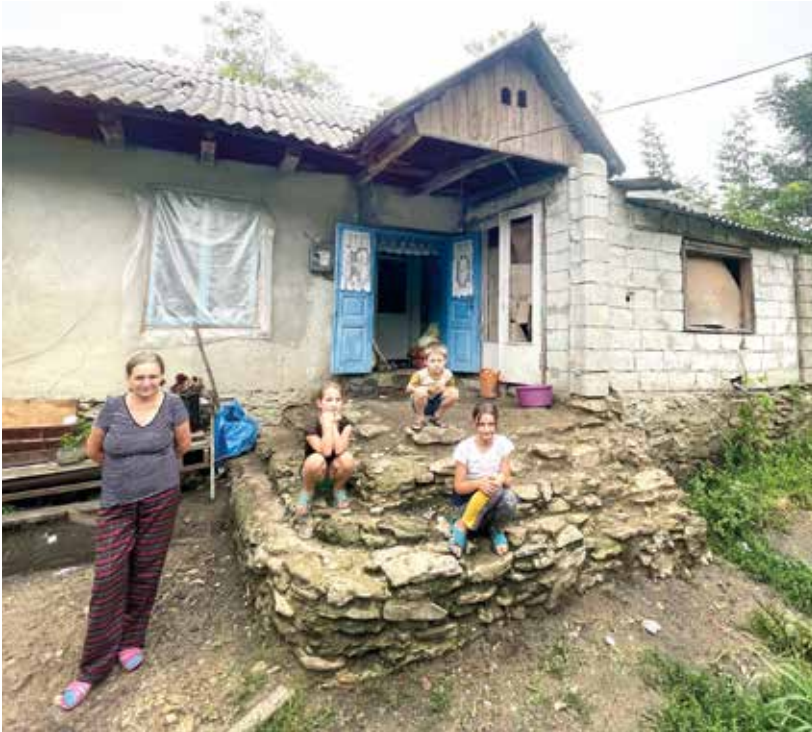
Originalzustand des Anwesens HASNAS vor unseren Renovationsarbeiten

zeigen, was wir mit den für dieses Projekt zugedachten Spenden, erreichen konnten.