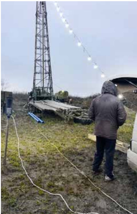
■ Bild links: Die Beleuchtung der Baustelle ist notwendig geworden, da der Bauunternehmer geplant hat, auch des Nachts die dringend notwendigen Arbeiten vor dem angekündigten Schneefall, auszuführen.