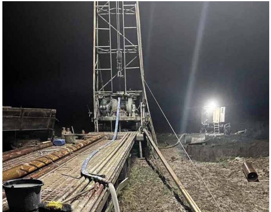
■ Bild rechts: Es ist Nacht geworden. Trotz beißender Kälte werden die Bohrarbeiten mit Nachdruck ausgeführt.