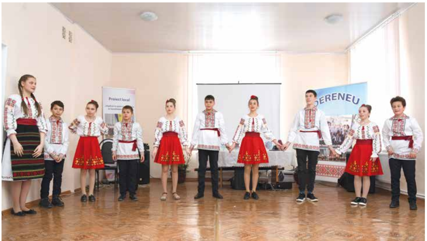
Jugendliche in moldauischer Tracht führen einige Tänze auf

Nach und nach füllte sich der festlich ausgeschmückte Raum, den auch eine Videoleinwand zierte. Nachdem uns der Bürgermeister vorgestellt und auch einige Honoratioren begrüßt hatte, wurde ein Videofilm mit kurzen Sequenzen, welche unsere Projekte darstellten, vorgeführt. Auf diesen waren die bisherigen