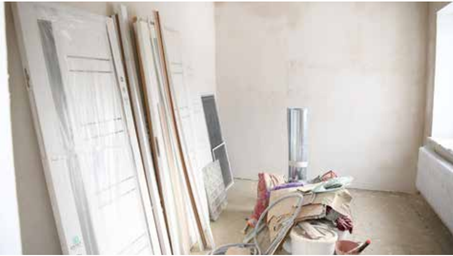
In diesem Raum sollen für Notfälle drei Betten dauerhaft installiert werden, um besonders gefährdete Personen, insbesondere in der Winterzeit, temporär unterbringen zu können

Arbeiten sowohl des Sozialzentrums, als auch der Wasserbohrung und des instandgesetzten Wasserreservoirs deutlich erkennbar. Der Bürgermeister bedankte sich sehr herzlich in einer sympathischen Ansprache bei allen an diesen Projekten beteiligten Firmen und Personen. Im Anschluss wurde landestypische Volksmusik laut und ganz plötzlich platzte eine festlich gekleidete Jugendschar in den Raum, die anmutig landestypische Tänze darstellte.